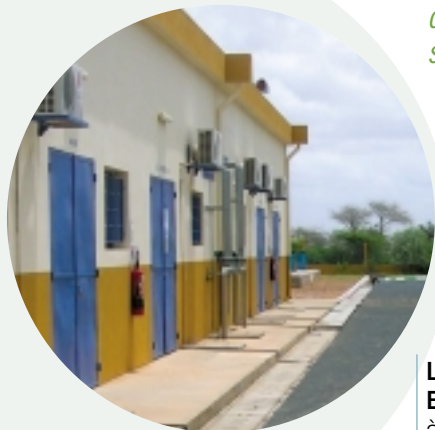
L'usine "test" pour la démarche S&ST était isolée de toute infrastructure et des premiers secours.

>>>>> Starting out from a risk analysis system co-integrating health, safety and environment dimensions, the Sénégalaise des Eaux has progressively deployed its QSE approach into a core sustainable development strategy.