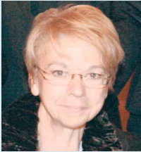
Présidente de la commission de normalisation Management de l'innovation