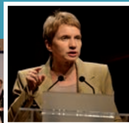
Laurence Parisot, présidente du Medef / President of the "Medef"