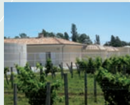
La Cuma de Saint-Emilion, un exemple d'intégration environnementale, reconnu par une certification QSE.