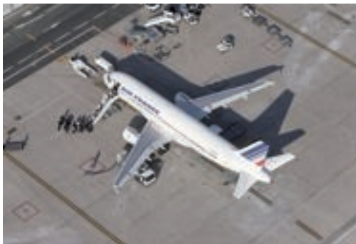
Un outil pour partager les bonnes pratiques entre escales. A tool to share good practices between stopover.